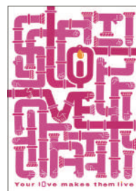
佳作：余碧晴／Your iDve makes them live