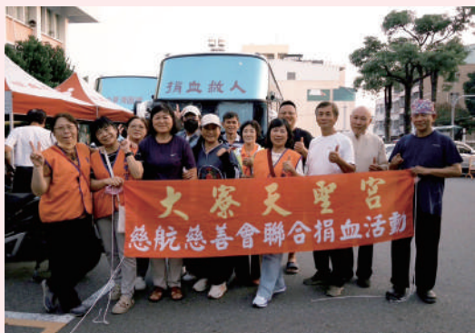
與慈航慈善會一同舉辦捐血活動。