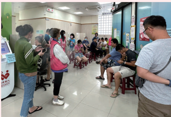
現場等候捐血的民眾。

並非固定捐血人，只是「偶爾、久久一次」去捐。但當玉皇宮正式投入，他很清楚，自己必須扮演帶頭的角色。每一場活動，他都親自到場，和大家一起捐血、一起等待，用行動鼓舞現場士氣。