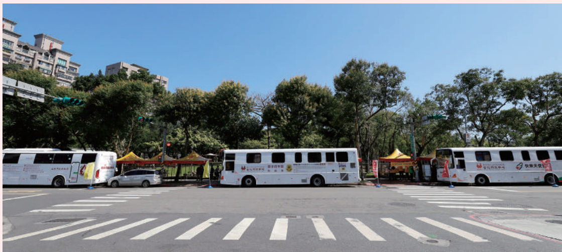
三輛捐血車一字排開的壯觀景象，如今已成為每年三次活動的熟悉風景。

「我們會做各種分析，例如各時段捐血人數統計、新增人數統計、回流狀況分析等等，用這樣的數據整理，預測未來捐血人數和數量，有助於長期策略的規劃；在活動進行當中，也較容易察覺異常，便於即時做出補救措施。」靈活運用各種宣傳行銷的工具：舉凡官方