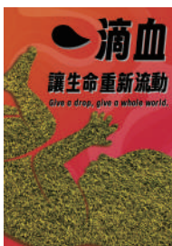
佳作：張宛婷／流動的生命 Flowing Life