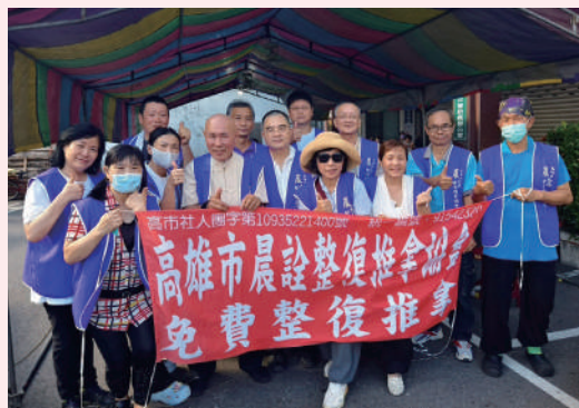
與高雄市晨詮整復推拿協會一同舉辦捐血活動。

害；再多一點陪伴與鼓勵，很多時候，只要有人陪著一起來，恐懼就會少一半，勇氣也就自然多一點。