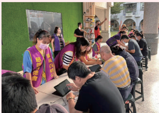
志工團隊協助引導動線及填寫資料。

亦是關鍵。現場志工分工明確，從引導動線、協助填寫資料，到關懷捐血者狀況，各環節皆能有效銜接，確保活動順利進行。許多志工長期參與，對活動流程相當熟悉，成為現場不可或缺的重要力量。